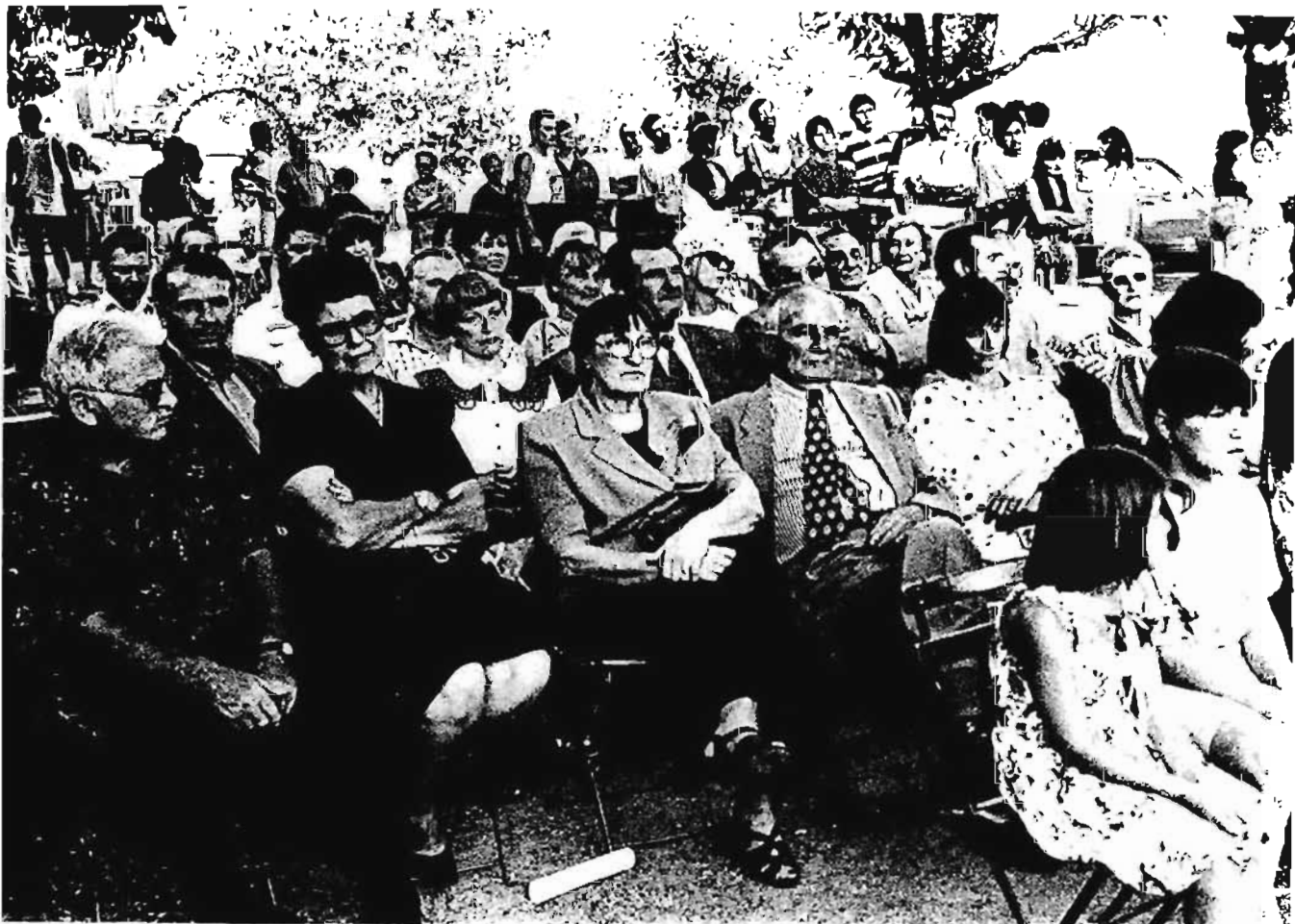
Les permanents pendant la fête